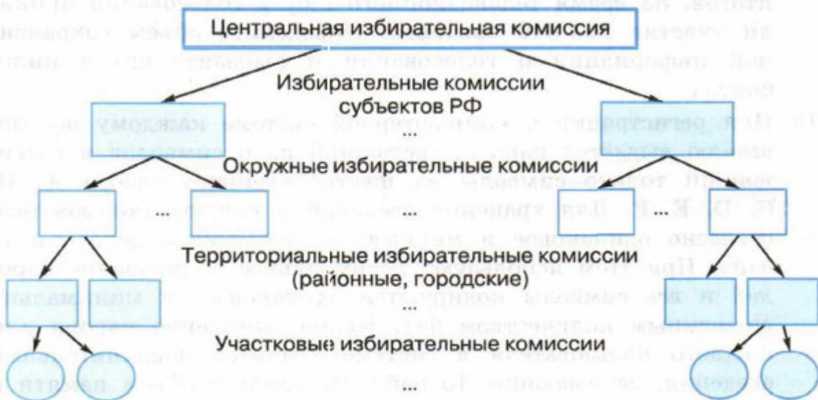
Рис. 1.9. Система избирательных комиссий в Российской Федерации

Соединение, интеграция отдельных элементов приводит к системному эффекту — возникновению у системы новых свойств, не присущих ни одной из её составных частей. Нарушение элементного состава или структуры системы ведёт к частичной или полной утрате её функциональности.