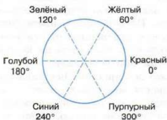
Рис. 3.9. Круговое расположение цветов

Цветовой оттенок (Hue) — один из цветов спектра. Конкретный цветовой оттенок кодируется либо величиной угла, либо длиной дуги на цветовом круге (рис. 3.9).