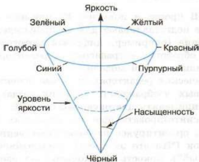
Рис. 3.10. Цветовая модель HSB

Пространство цветов модели HSB может быть представлено в форме вложенных концентрических конусов с общей вершиной и общей осью симметрии (рис. 3.10).