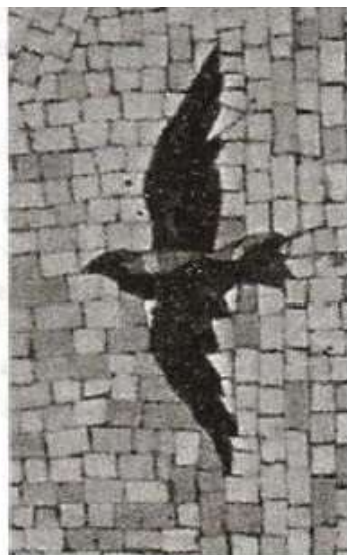
Рис. 3.7. Фрагмент мозаичного полотна на станции московского метро «Маяковская»

Растровое графическое изображение состоит из отдельных маленьких элементов — пикселей (pixel — аббревиатура от англ. picture element — элемент изображения). Оно похоже на мозаику (рис. 3.7), изготовленную из одинаковых по размеру объектов (разноцветных камешков, кусочков стекла, эмали и др.).